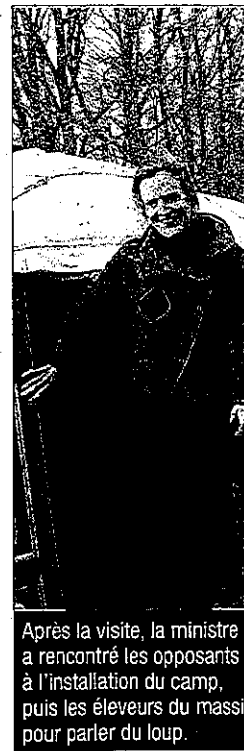
Après la visite, la ministre a rencontré les opposants à l'installation du camp, puis les éleveurs du massif pour parler du loup.